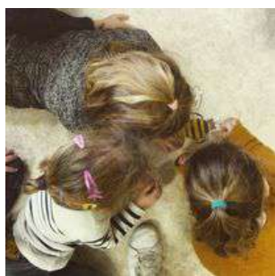
Centre Bretagne Nature