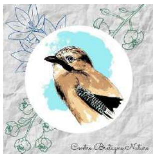
Centre Bretagne Nature

Infos 02 97 51 15 14 ; www.lecartonvoyageur.fr